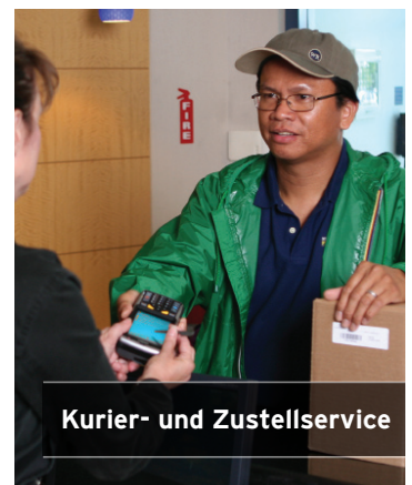
Kurier- und Zustellservice